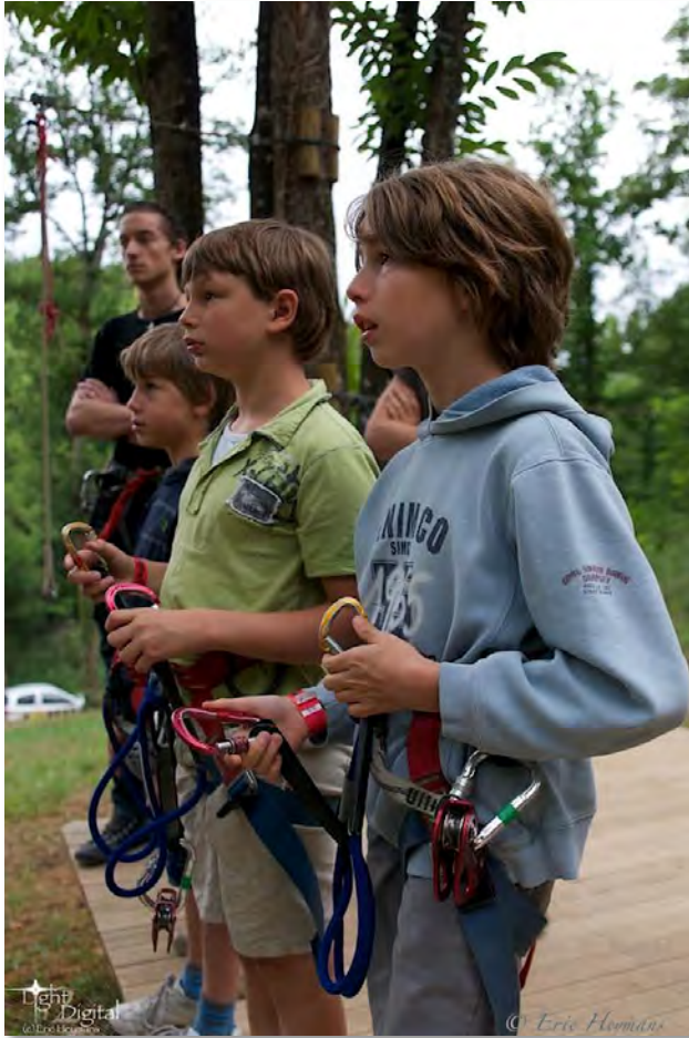
Figure 19 : Accro-branches - Dordogne