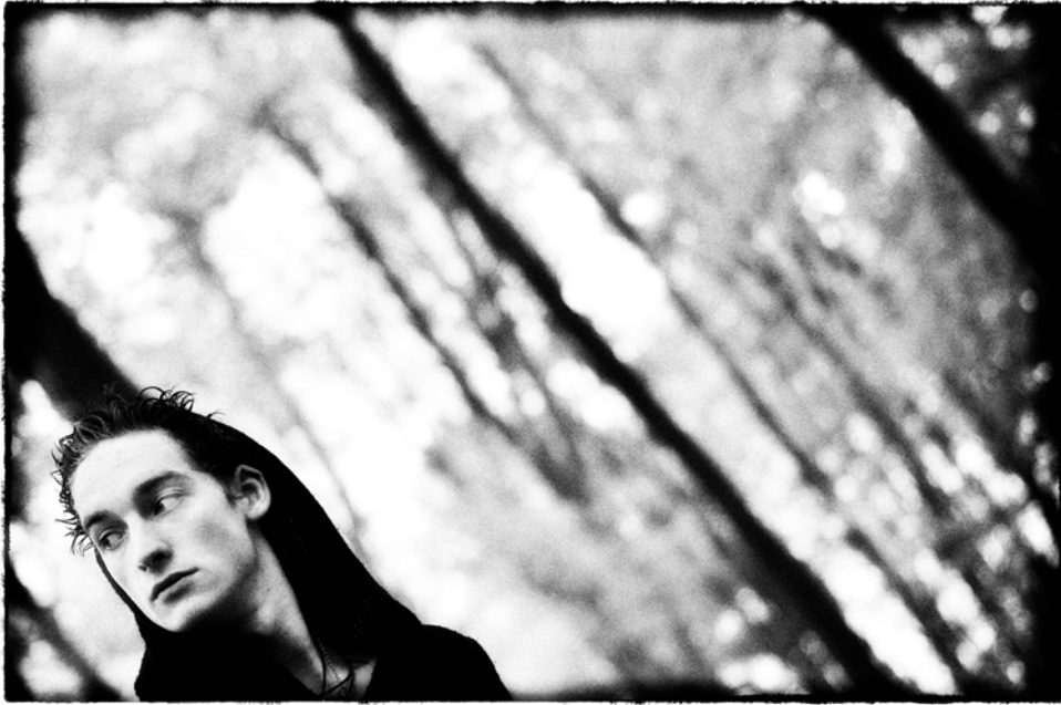
Figure 4 : Portrait - Nivelles