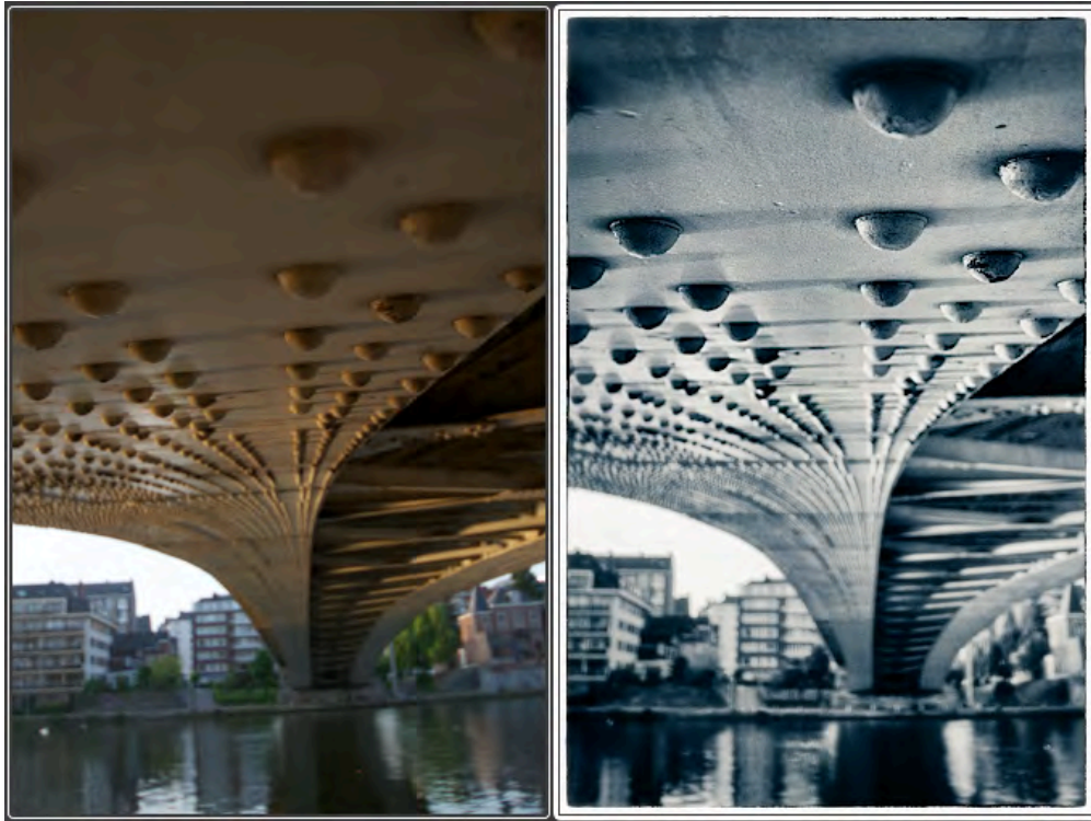
Figure 3 : Pont sur la Meuse - Namur