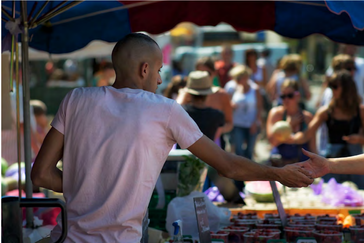
Figure 21 : Marché de St Rémy - Provence