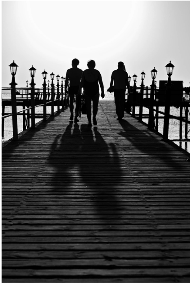
Figure 6 : Ponton - Egypte