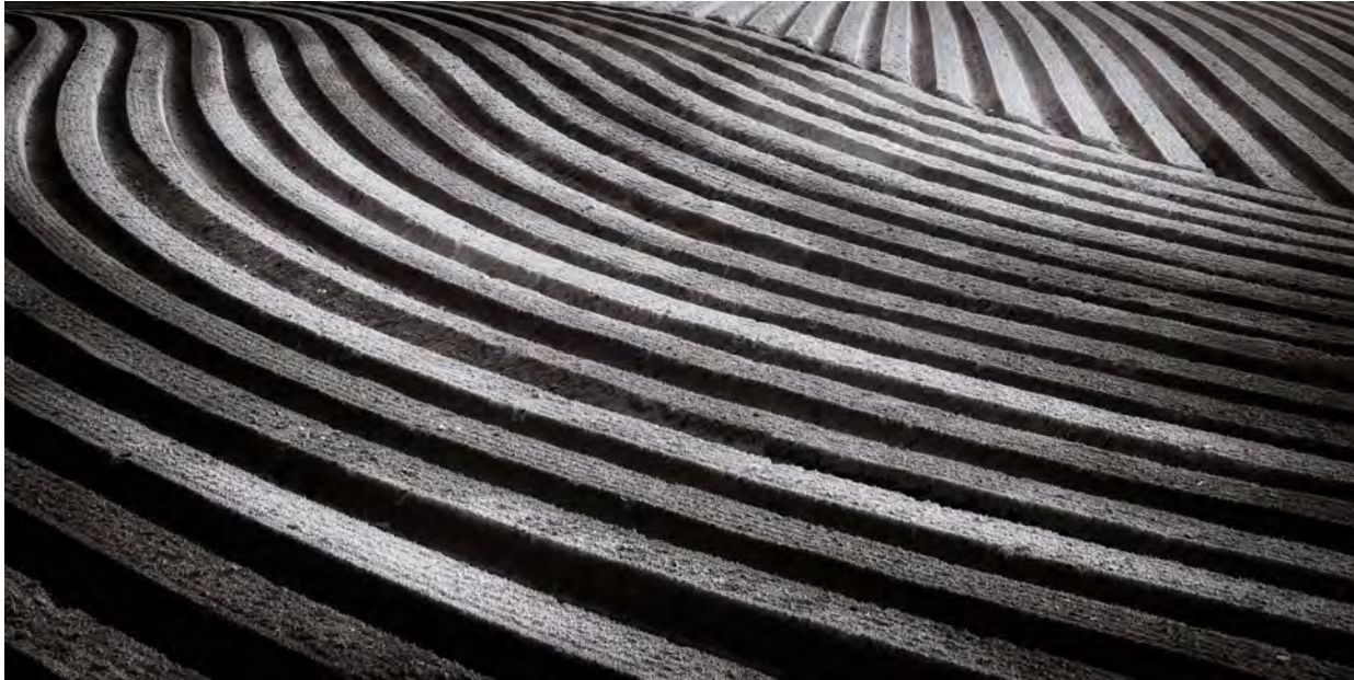
Figure 5 : Champ Labouré - Nivelles