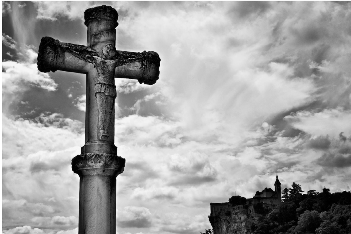
Figure 8 : Croix et Rocamadour - France