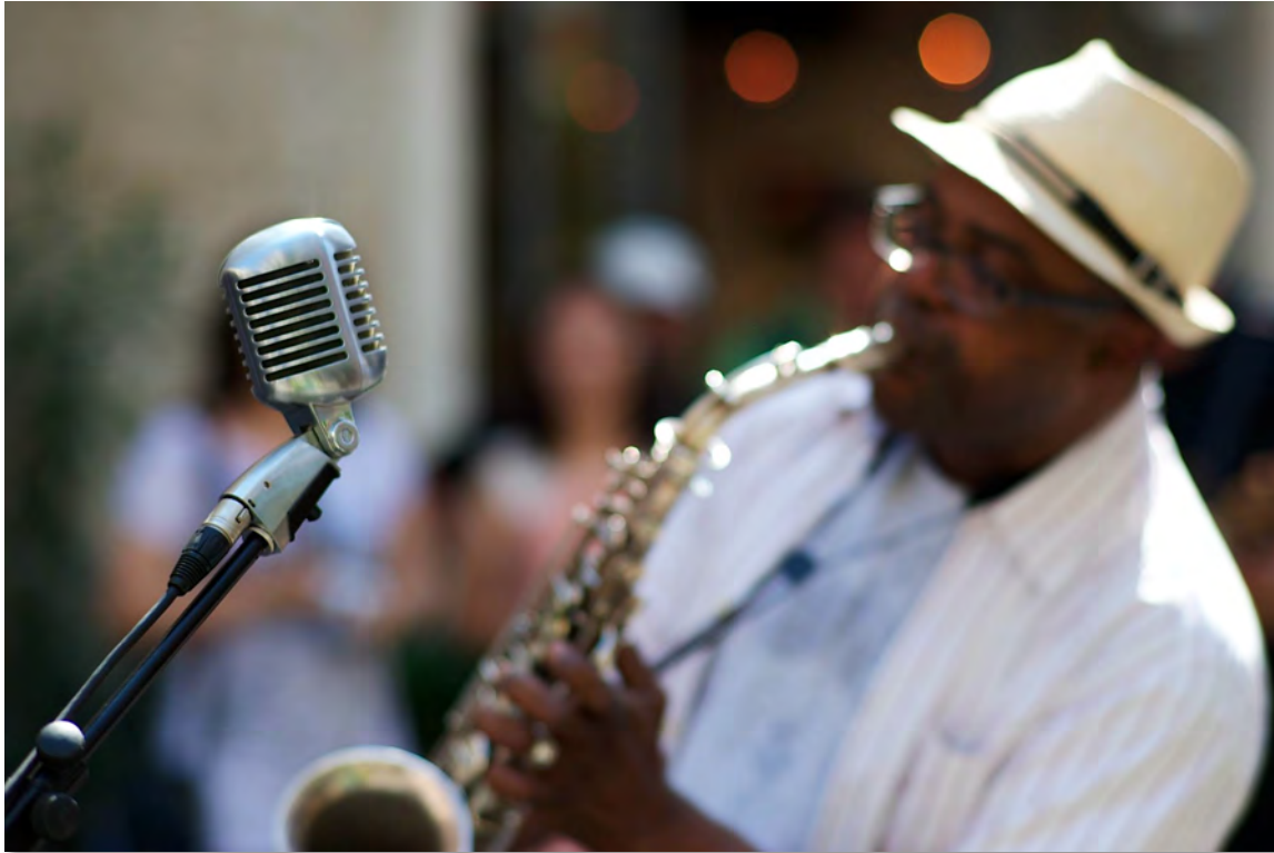
Figure 20 : Joueur de Saxo - St Rémy de Provence