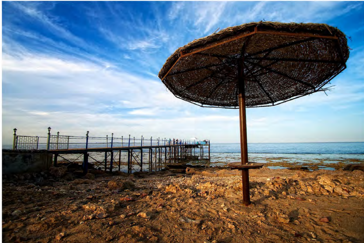
Figure 7 : Ponton - Egypte