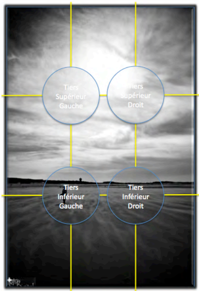
Figure 12 : Règle des Tiers – Application sur un paysage