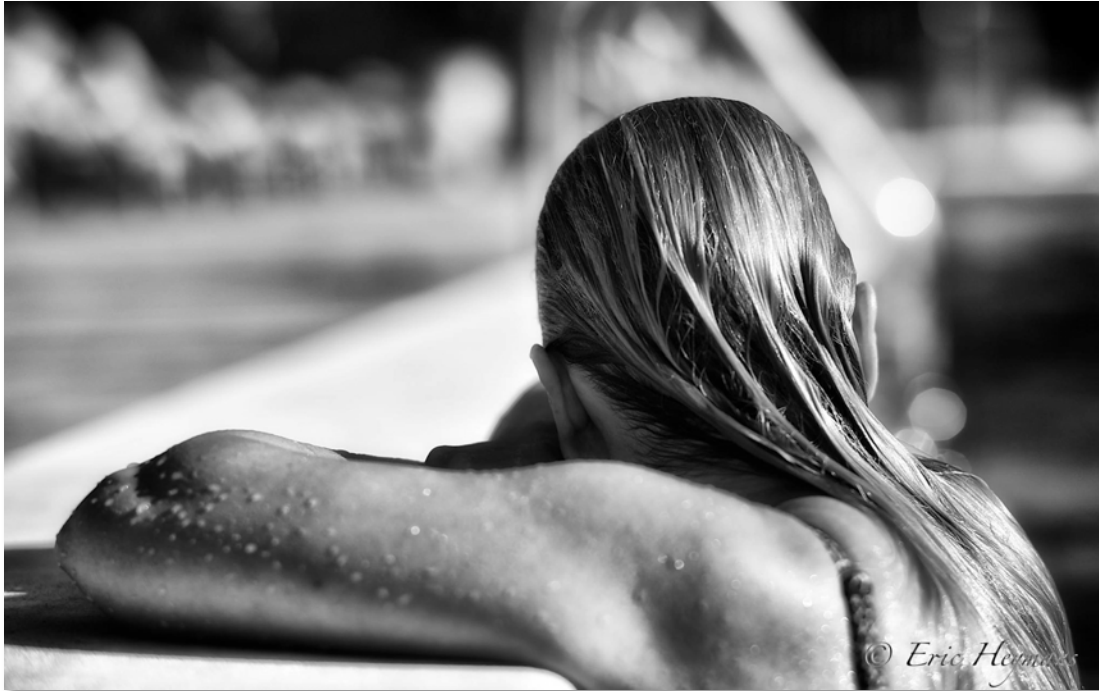
Figure 16 : Un peu de repos - Avignon