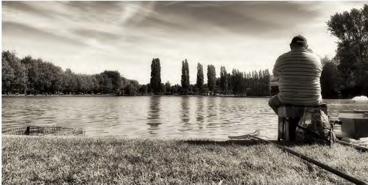
Figure 15 : Pêcheur - Nivelles