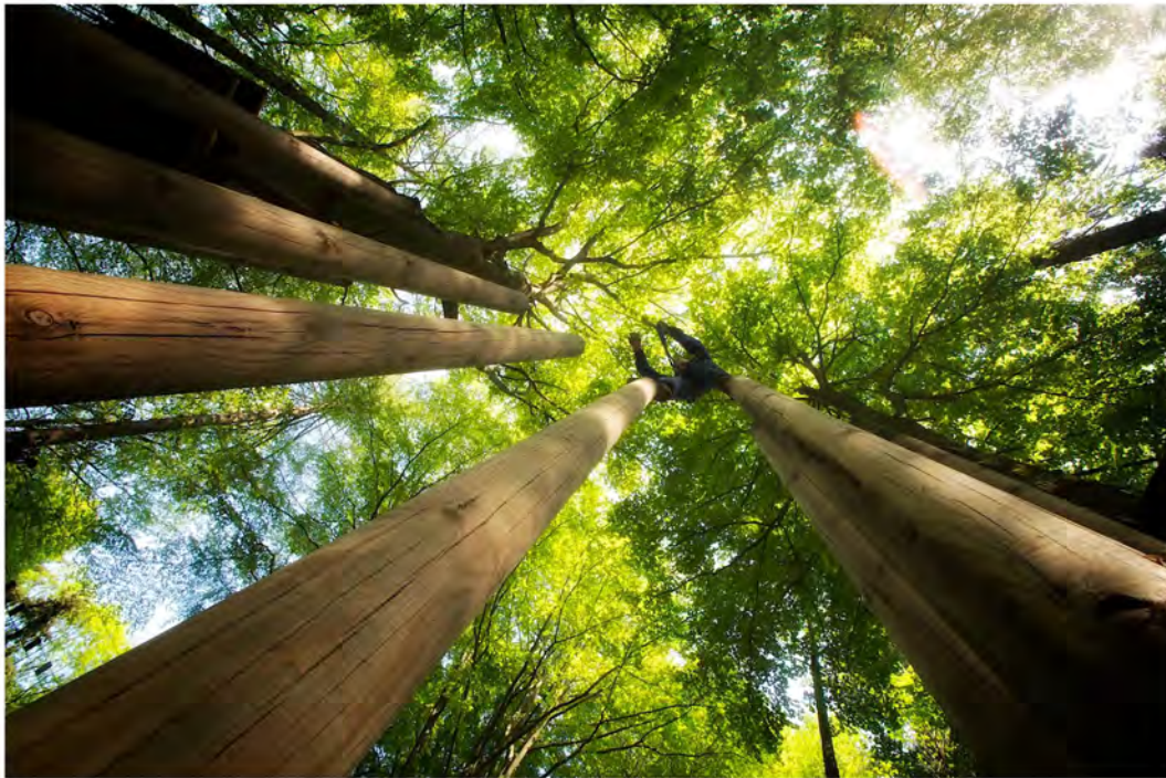
Figure 14 : Adventure Parc - Wavre