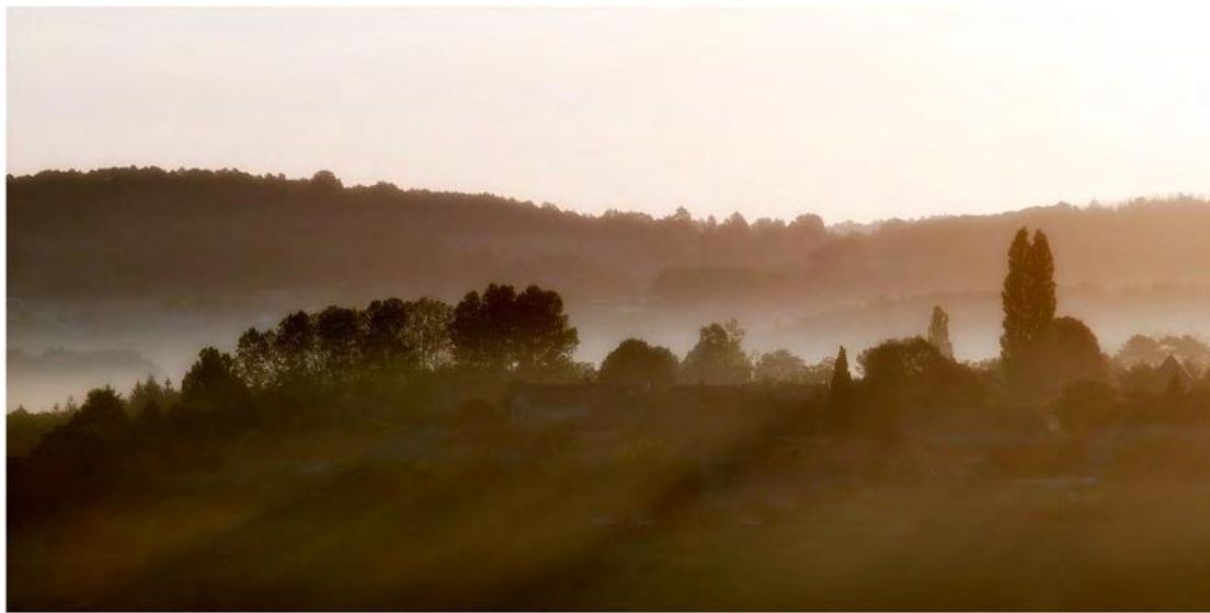
Figure 9 : Dordogne - France