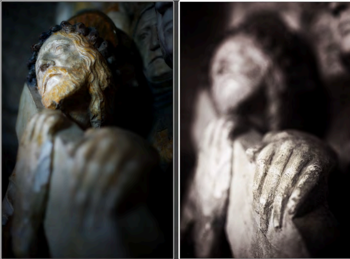
Figure 1 : Un sujet, deux histoires - Palais des Papes - Avignon