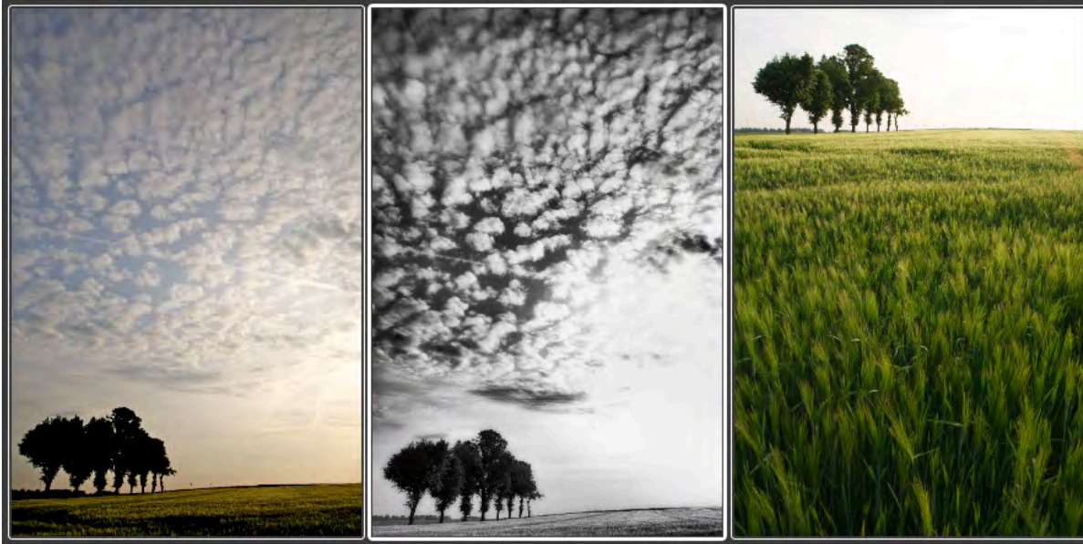
Figure 2 : Un sujet, des histoires - Banlieue de Nivelles