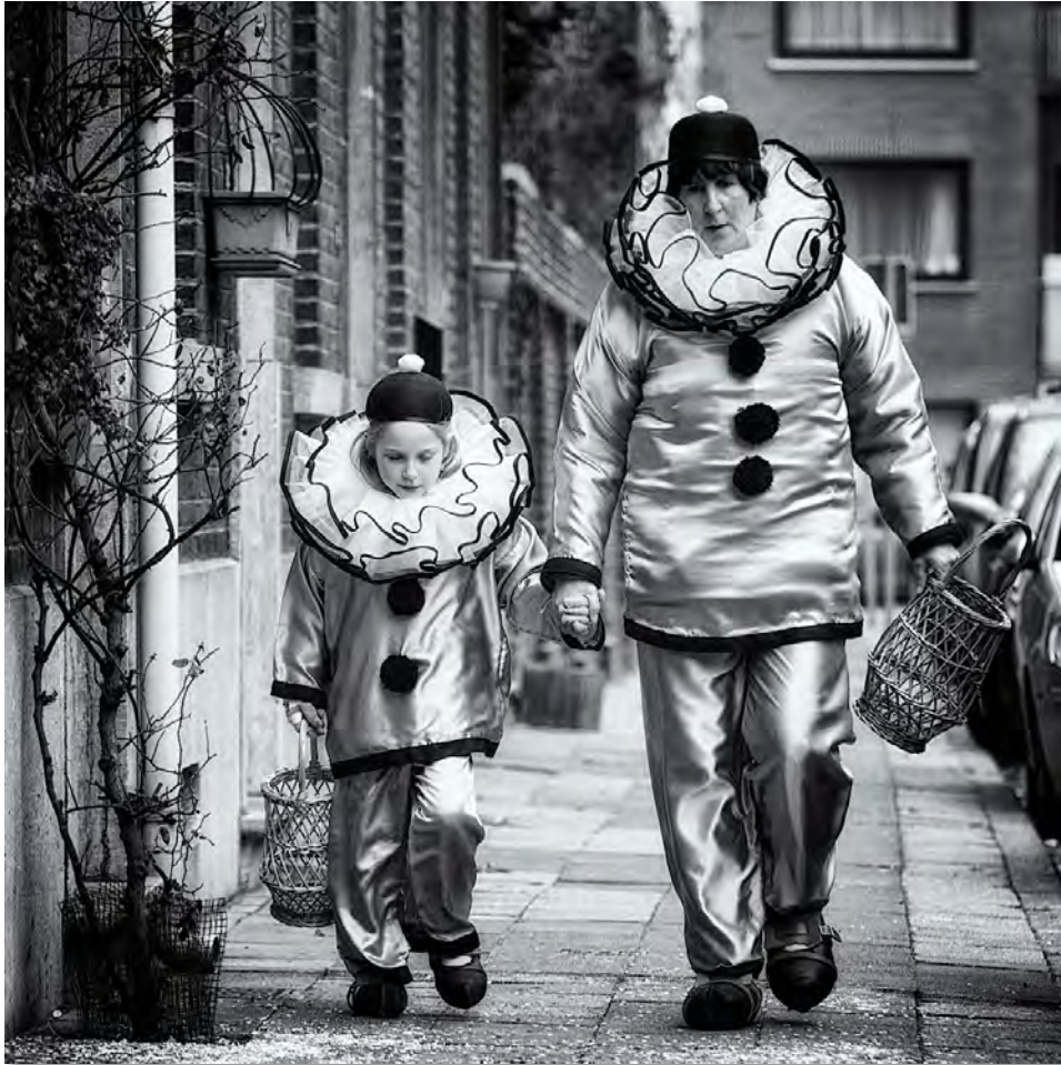
Figure 17 : Enfant au Carnaval - Nivelles